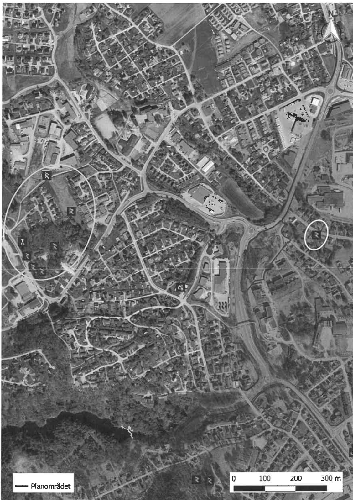
Figur 2. Reguleringsplanen omfatter et delvis ubebyggt areal like øst for Rv 36 og rundkjøringa hvor man tar av mot Klyve. Det er kjent flere automatisk fredete kulturminner i nærheten, blant annet gravfeltene på Klyve, markert med gul sirkel. På 30-tallet ble det gjort funn av en grav fra vikingtid kun 150 meter øst for planområdet, markert med hvit sirkel.