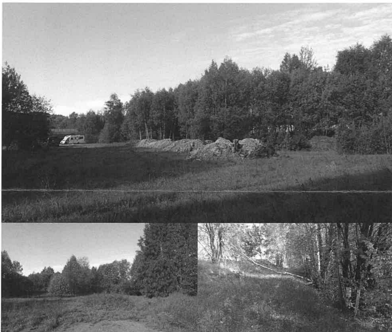
Figur 3. Øverst; Søndre del av planområdet, tatt mot SV. Nederst til venstre: Nordre del av planområdet, tatt mot SV. Til høyre: Gassledningstraseen, tatt mot N.

Terrenget i planområdet er generelt flatt, men nordre del har muligens opprinnelig vært noe mer småkupert rundt bekken. Det er i moderne tid gjort betydelige inngrep i området, blant annet er det utplanert og påført betydelige mengder masser. I sør har det inntil ganske nylig stått et bygg. Langs vestsiden av planområdet, inn mot veien, ligger det en gassledning. Området brukes i dag til parkeringsplass og mellomlagring av masser.