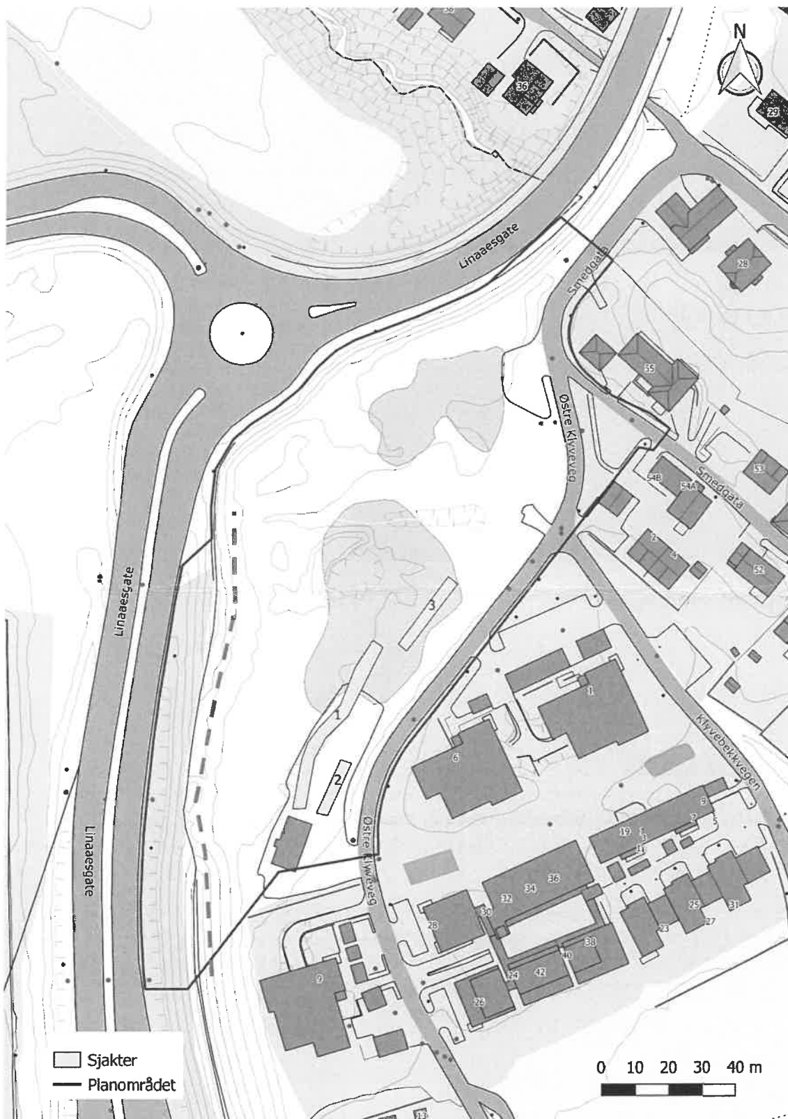
Figur 4. Kart over planområdet med sjaktene. Rød stiplet linje markerer gassledningen omtrentlig. Bygningen i sør er revet.