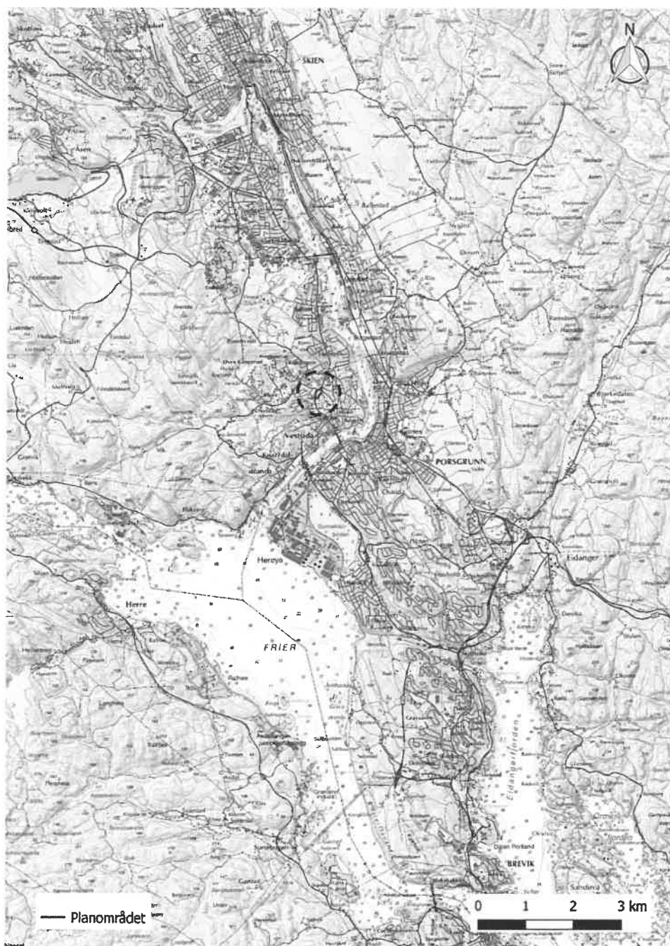
Figur 1. Planområdet ligger nordvest i Porsgrunn kommune, rett ved grensa til Skien.

Det er fra tidligere kjent automatisk fredete kulturminner i nærhet til planområdet, blant annet flere gravminner fra jernalder.